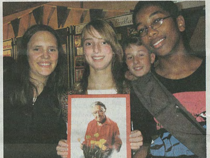
Schüler mit einem Foto von Corrie ten Boom, die 1983 starb.

ten kommt es vor, dass Entlassene sich bei der Wache für Verpflegung und Behandlung bedanken.“ Auch der Schriftsteller und Anarchist Erich Mühsam zählte zu den Inhaftierten. Kurz nach der NS-Machtergreifung wurde er ins Lager gebracht: zerschlagen, halbblind, auf dem Kopf hatte man ihm ein Hakenkreuz geschoren. Eines Tages fragte ihn der SS-Sturmchef: „Wie lange denken Sie noch, in der Welt umherzulaufen?“ Mühsams Todesurteil. Corrie ten Boom hat Ravensbrück überlebt. Ihre Schwester Betsie starb im La-