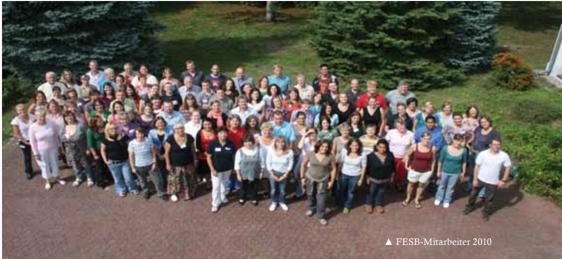
▲ FESB-Mitarbeiter 2010