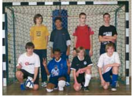
▲ Halbjährliche Fußballturniere