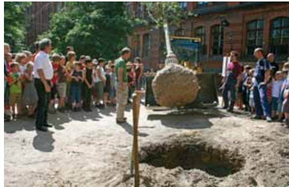
▲ Schüler und Mitarbeiter pflanzen gemeinsam mit dem Sponsor eine 15 Jahre alte und acht Meter hohe Silberlinde auf dem Schulhof am Standort Prenzlauer Berg in der Christburger Straße