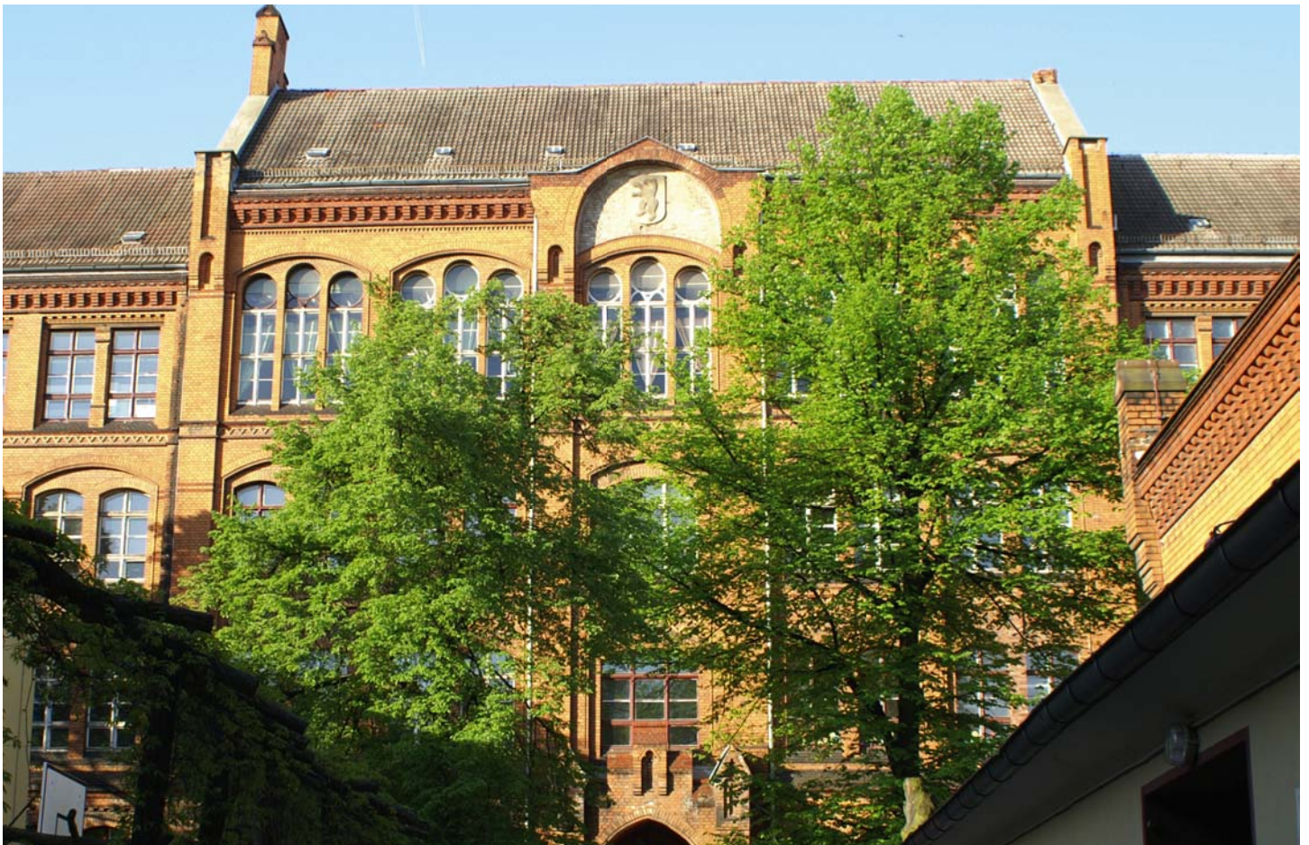
Das Nord-Dach unseres Schulgebäudes in der Christburger Straße im Prenzlauer Berg

2008 – Das besondere Jahr! – Es geht weiter!